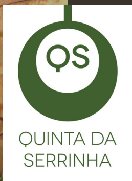
Quinta da Serrinha, Alfândega da Fé