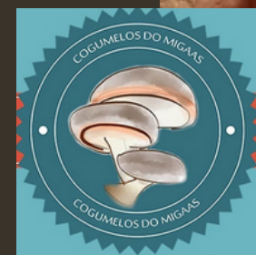
Cogumelos do Migaas, Penafiel