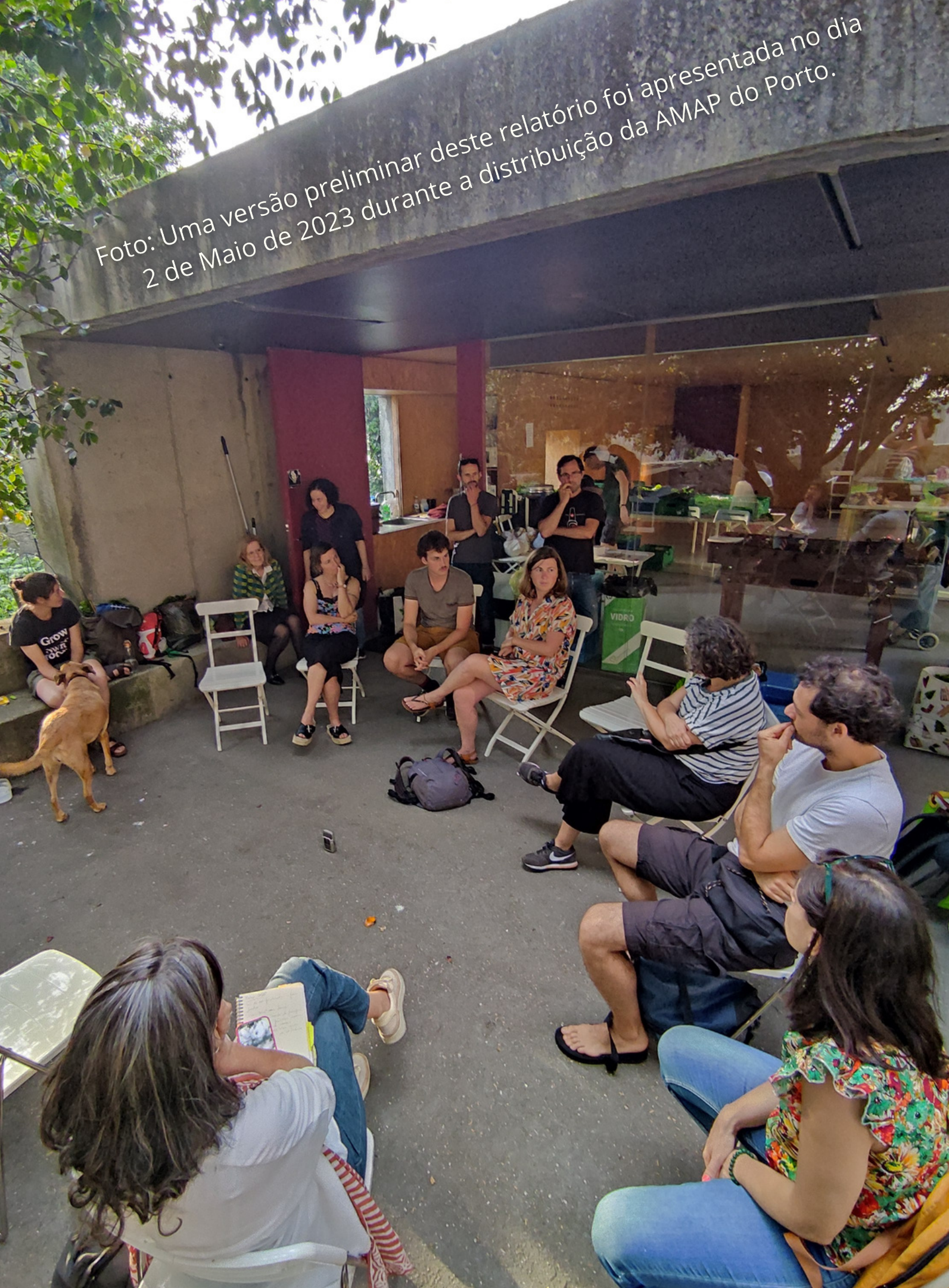
Foto: Uma versão preliminar deste relatório foi apresentada no dia 2 de Maio de 2023 durante a distribuição da AMAP do Porto.