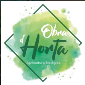
Obra de Horta, Arcozelo, Vila Nova de Gaia